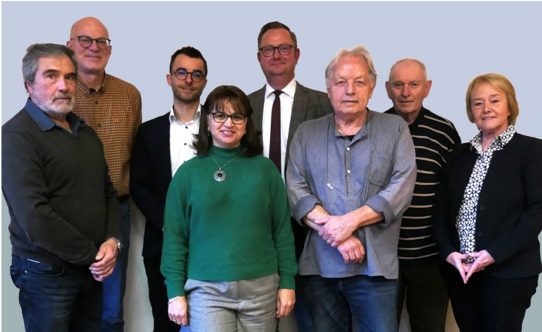
Vorstand der Bürgerstiftung