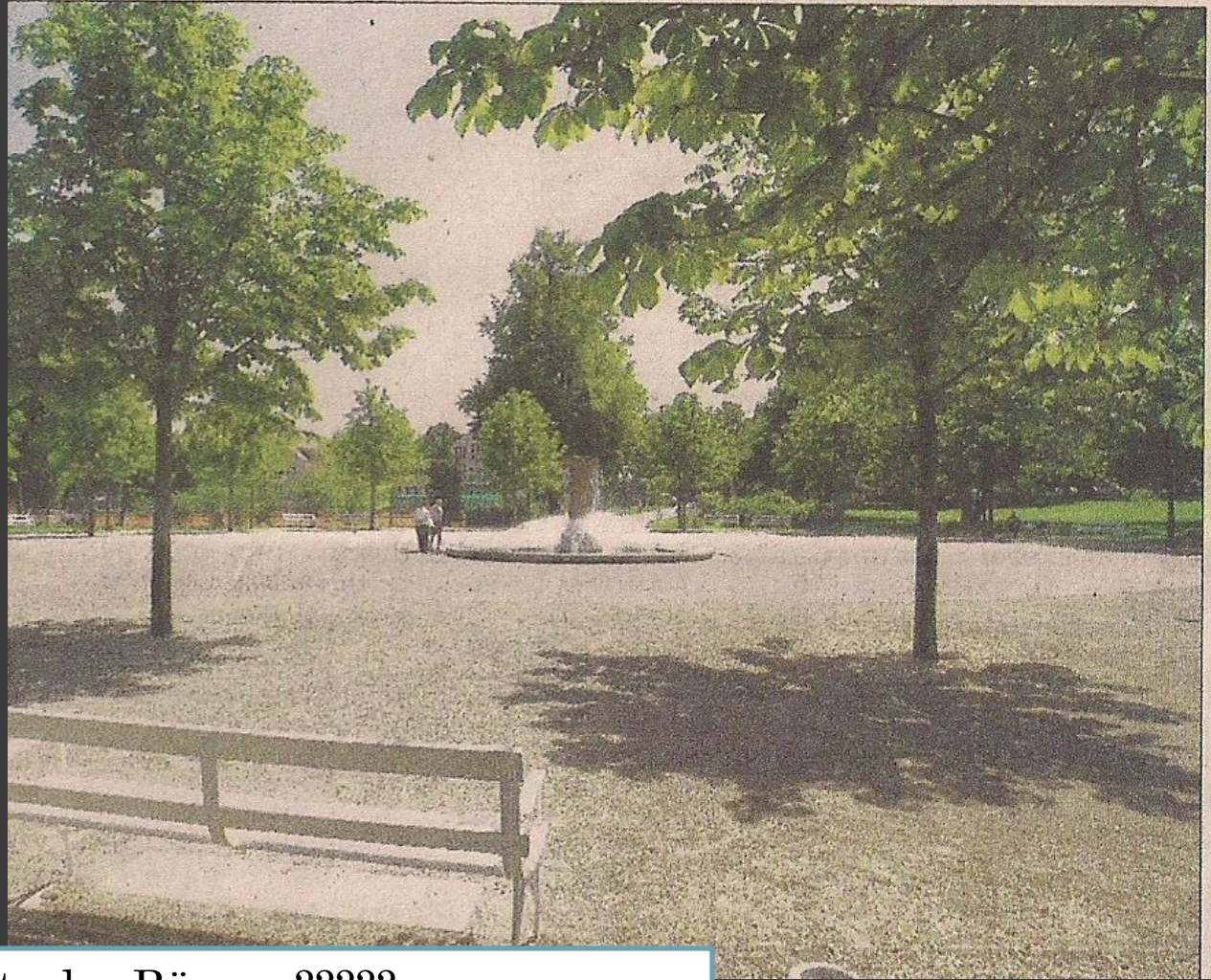
Platz der Bürger ?????