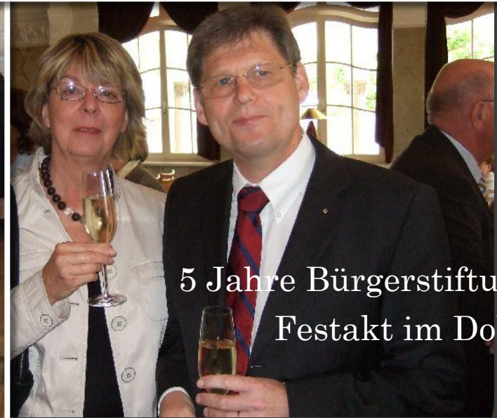
5 Jahre Bürgerstiftung Festakt im Dolce